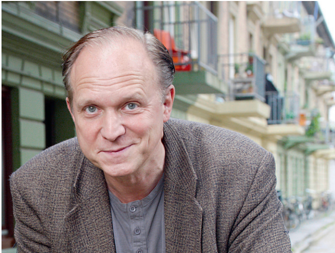
Ulrich Tukur ist Genussmensch und Schirmherr von Hilf Mahl!

Gutes Essen und guter Wein beflügeln unsere Sinne, öffnen das Herz und bereichern unser Leben.“ Worte, die man Ulrich Tukur, Schauspieler, Musiker und Genussmensch, sofort abnimmt. Legendar sind auch seine Restaurantkritiken für SZENE HAMBURG ESSEN + TRINKEN . Und so ist es nicht weiter verwunderlich, dass er für die gemeinnützige Gesellschaft Hilf Mahl! als Schirmherr fungiert. Hilf Mahl! sammelt im vierten Jahr über die Wintermonate Spenden für obdachlose Menschen in Hamburg, und zwar auf bestechend einfache Weise: Sie, werte Leserinnen und Leser, gehen in einem guten Restaurant essen, finden auf dem Tisch eine Notiz, die darauf hinweist, dass Ihre Rechnung um einen Euro höher ausfällt, solange Sie keinen Einwand erheben. Aufstocken ist natürlich auch erlaubt. Diese Euros werden von dem Gastronomen abgeführt und kommen ausgesuchten Hilfsorganisationen wie dem Hinz & Kunzt-Winternotprogramm , dem Containerprojekt für Frauen oder der Schwerpunktpraxis in der Hamburger Innenstadt zugute. Hilf Mahl! arbeitet ehrenamtlich und kann deshalb die eingesammelten Spenden zu 100 Prozent weitergeben. Anlass genug, mal wieder gut essen zu gehen. Die Liste der teilnehmenden Restaurants finden Sie auf der Internetseite. Kleiner Hinweis an mitleidende Gastronomen: Engagieren Sie sich ebenfalls, melden Sie sich bei Hilf Mahl! und sammeln Sie über die Wintermonate Spenden ein, damit Essen, Kleidung und Medikamente an Obdachlose verteilt und Notunterkünfte betrieben werden können. / lis